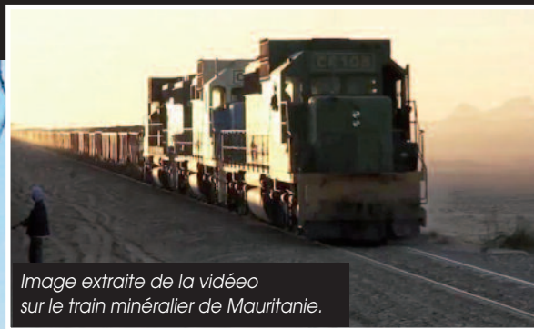
Image extraite de la vidéo sur le train minéralier de Mauritanie.

L'Afrique australe, ce sera dans quelque mois...